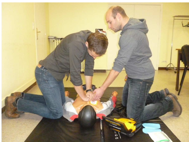
Séquence de formation SST

L'employeur doit prendre les mesures nécessaires pour assurer les premiers secours aux accidentés et aux malades ( Code du Travail, Article R. 4224-16 ). La présence d'un sauveteur secouriste du travail permet de répondre à cette obligation.