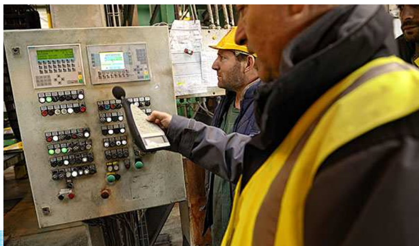
Mesure de bruit en atelier

Toutes ces données récoltées sont ensuite analysées au bureau des mesures. Cela permet ainsi d'établir un état initial pour établir la conformité ou non du site.