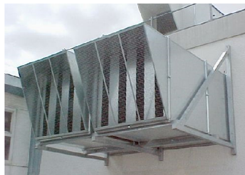
Silencieux à baffle

Les silencieux s'utilisent essentiellement sur les conduits de ventilation, d'aération ou de climatisation. Elles permettent de limiter les nuisances pour le voisinage.