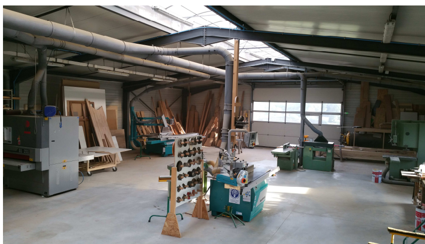
Atelier de travail du bois

Contactez la CNAMS et profitez désormais de cette nouvelle offre de services.