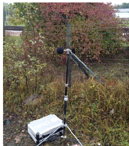
Capteur de bruit

Généralement, les valeurs fixées par l'arrêté d'autorisation ne peuvent excéder 70 dBA pour la période de jour et 60 dBA pour la période de nuit.