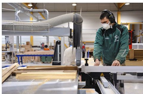
Travail du bois

La CNAMS vous aide à faire le point sur ces différents sujets. Contactez dès à présent les chargés de missions.