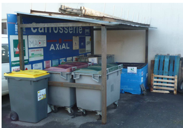
Abri à déchets

Définir sa zone de déchets est un élément essentiel. Cela permettra d'éviter de voir les déchets se disperser dans différentes zones de l'atelier.