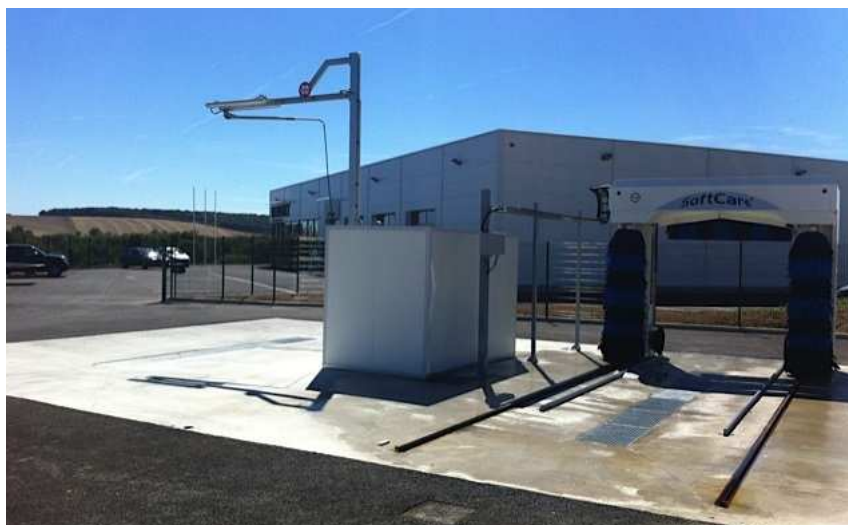
Aire de Lavage