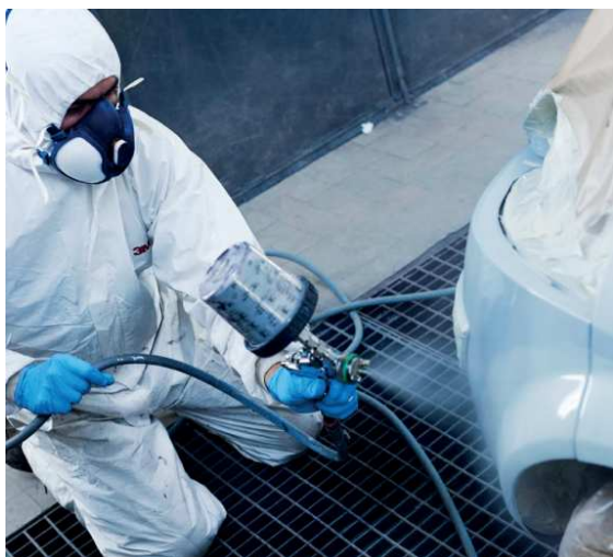
Mesure de bruit en atelier

Dans ce contexte, le carrossier est le principal concerné puisqu'il est le plus exposé lors de l'utilisation de ces produits. Une bonne gestion liée à l'usage des peintures permettra de pérenniser l'activité, d'améliorer les conditions de travail, de maîtriser les coûts d'exploitation, d'anticiper les évolutions réglementaires et de renforcer sa relation avec la clientèle.