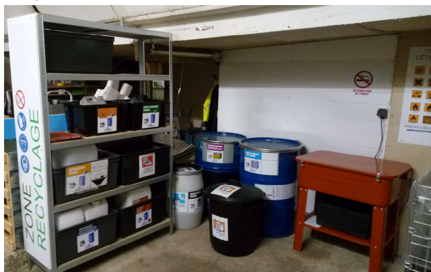
Zone de stockage de déchets sécurisée

Contactez, dès à présent, les chargés de mission de la CNAMS pour plus d'informations.